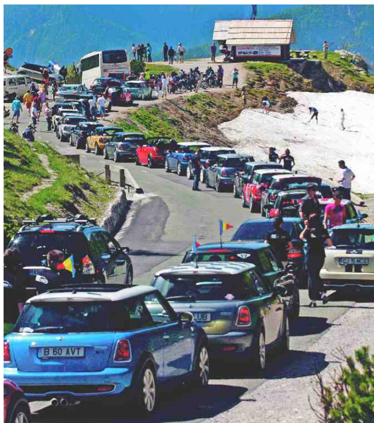
MINIJI SO ZAVZELI VEČ OVINKOV NA CESTI ČEZ VRŠIČ