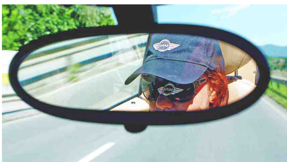
VSE V SLOGANU BE MINI (BODI MINI)