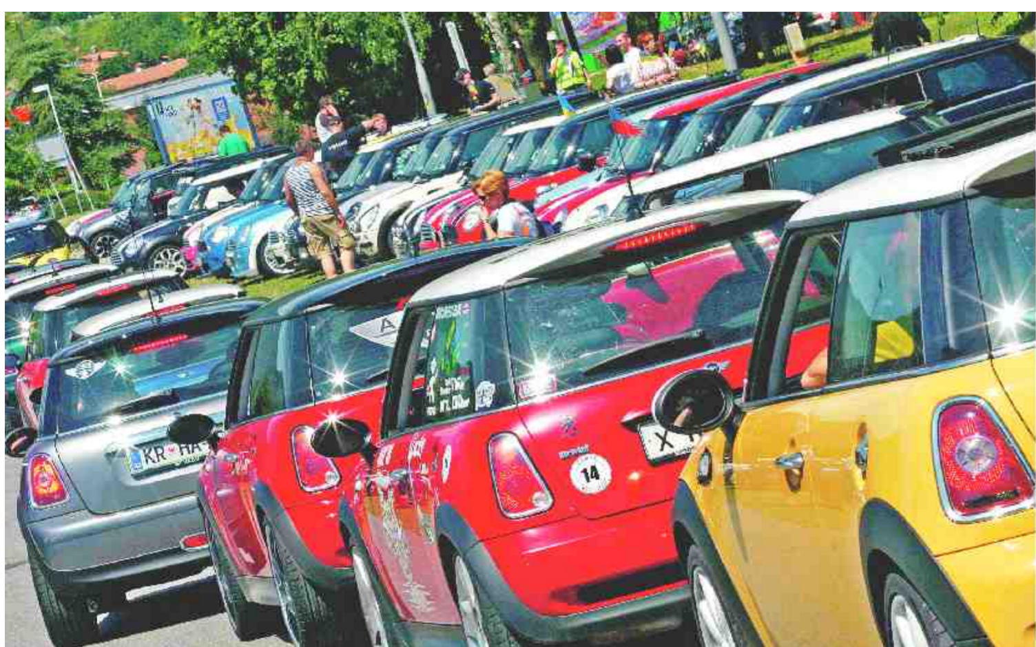
VSI DRUGAČNI, VSI ENAKOPRAVNI