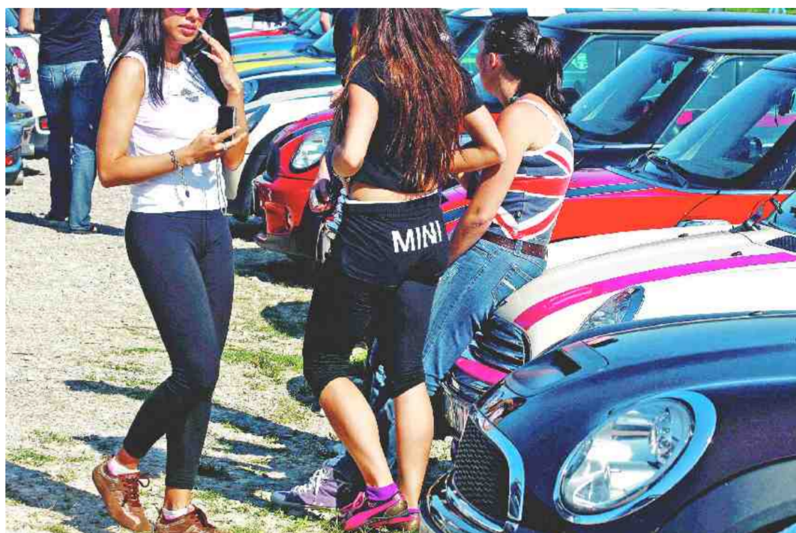
MINIJEV NE VOZIMO VEČ MISTRI BEANI, TEMVEČ MLADENKE IN MLADENIČI Z VELIKO ŠPORTNEGA DUHA