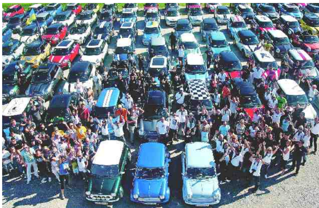
103 NOVA VOZILA IN 3 STARA